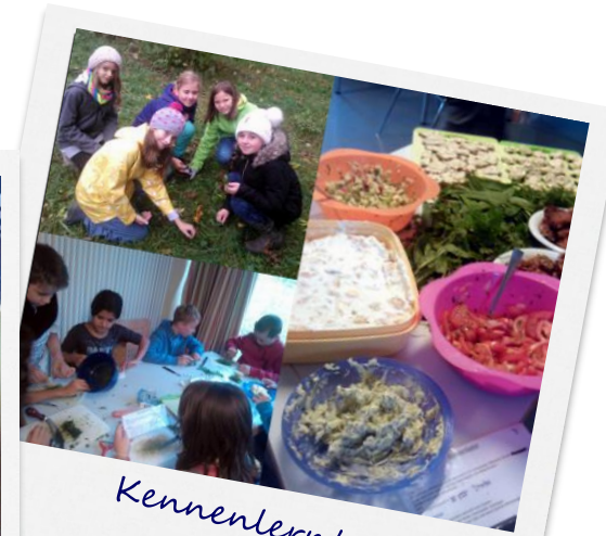
Kennenlertage 5. Klasse