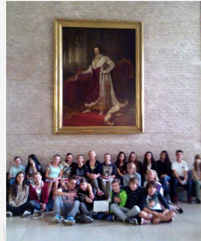
Kunstklasse in der Pinakothek